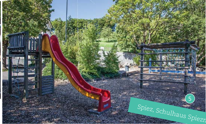
Spiez, Schulhaus Spiezmoos