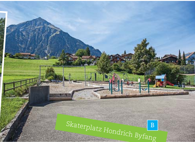
Skaterplatz Hondrich Byfang