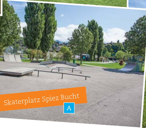
Skaterplatz Spiez Bucht